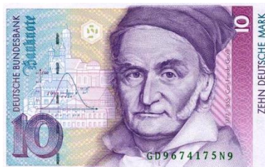
旧ドイツ10マルク紙幣に描かれたガウスと正規分布