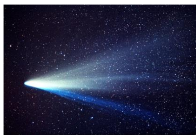
ほうき星が地球に落ちる確率は数千万年に一度と言われている