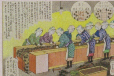
「撰炭機での作業 (撰炭婦)」

弁当を持って入坑する女性と赤ん坊の世話をする子ども。坑道は狭く、母親では子どもを背負うことができませんでした。