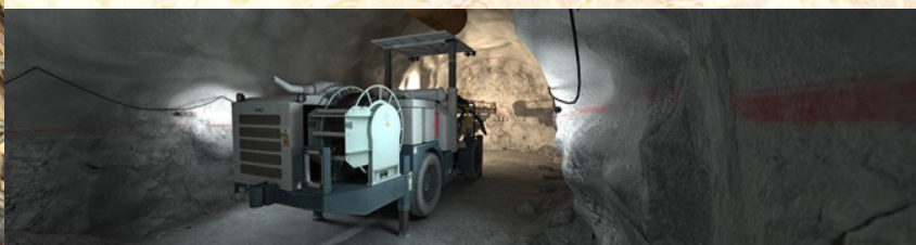
バーチャル鉱山システム イメージ映像