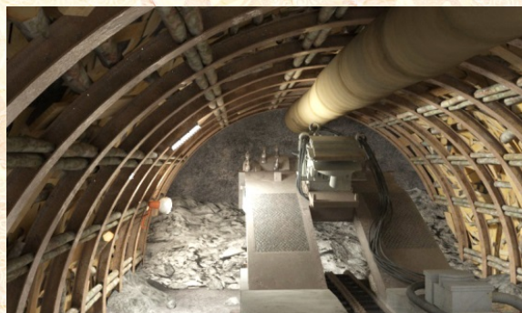
体験展示システム イメージ映像

体験展示システムでは3Dメガネ・ヘッドホン・コントローラーを使用して、60インチディスプレイに映し出されたバーチャル鉱山内を自由に散策することが可能です。3階講堂脇に設置しています。一度に最大4人まで体験可能です。