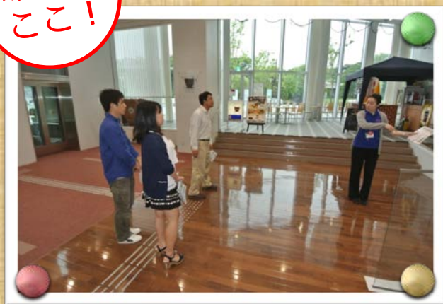
広場に面するカフェテラス前で展示します！