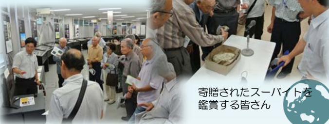
寄贈されたスーバイトを 鑑賞する皆さん