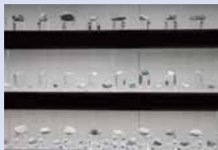
小さなスイの展示