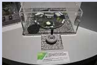
光を当てて鉱物の違いを観察