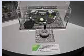
光を当てて鉱物の違いを観察