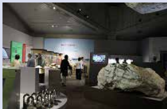
巨大なスイの展示