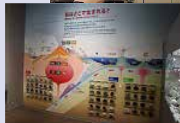
岩が貼り付けて展示されています