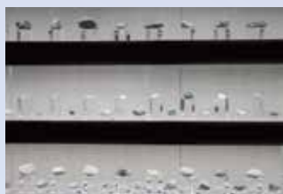
小さなヒスイの展示