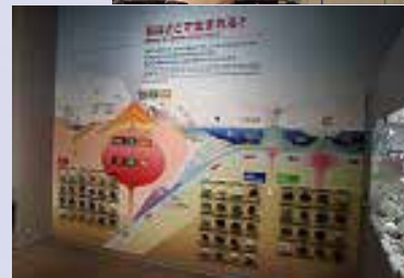
岩が貼り付けて展示されています