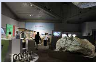
巨大なヒスイの展示