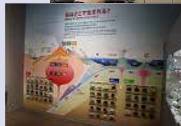
岩が貼り付けて展示されています