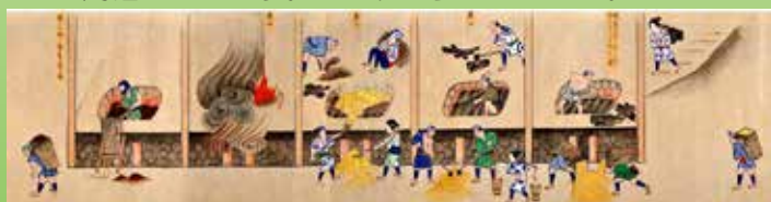
絵巻「銅山働方之図」の一場面

また、デジタルギャラリー公開を記念して講演会・ギャラリートークを開催いたします。ぜひ、ご参加ください。